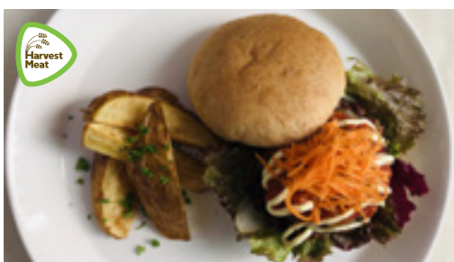
ハーベスト ミート・バーガー

大豆ミートは使わずに、島豆腐をひき肉のような味わいにしました。県産有機米、有機野菜もたっぷりです。