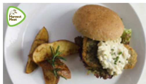
ヒエ・オ・ フィッシュ・バーガー

県産有機雑穀で作った満足系ヴィーガンミート! 波照間島産のオーガニック高キビ、旬のグリル野菜、コクのあるトマト味噌ソースのベストマッチ!