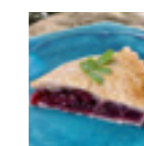
Today's Vegan Pie 本日のヴィーガンパイ