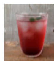
Homemade Enzyme Soda 自家製酵素スカッシュ