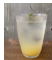
Organic Okinawa Citrus Soda シークワサー・スカッシュ (ノンシュガー)