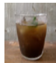
Detox Hemp Cola 麻炭デトックスコーラ