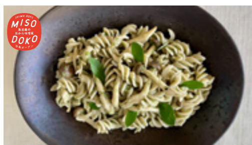
本日の おすすめパスタ

美味しい驚き! 雑穀のヒエと県産山芋で作った自家製精進お魚フライに特製ヴィーガントータル、全粒粉のパンズで大満足な一品に!